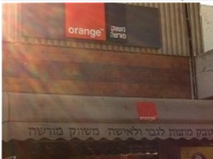
BOUTIQUE PARTNER ORANGE DANS LA COLONIE D'ARIEL

Or la colonisation est un obstacle majeur à la création de l'État palestinien et à une paix conforme au droit international.