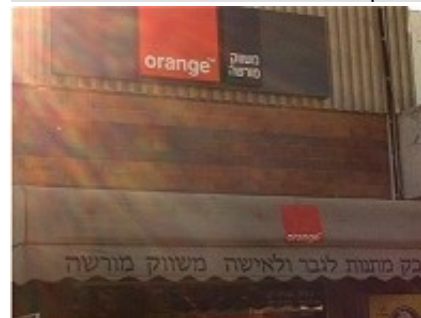
BOUTIQUE PARTNER ORANGE DANS LA COLONIE D'ARIEL

Or la colonisation est un obstacle majeur à la création de l'État palestinien et à une paix conforme au droit international.