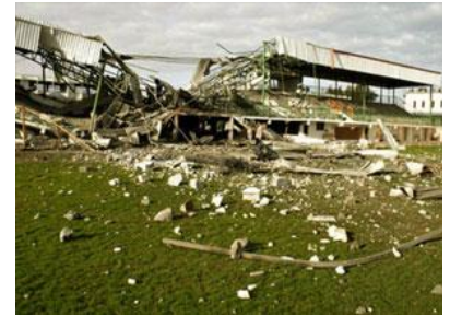
Missiles israéliens sur le stade de football de Gaza.

La politique israélienne a toujours été le nettoyage ethnique de la Palestine. Cela signifie la destruction de toute activité économique, politique, sociale, culturelle et sportive palestinienne.