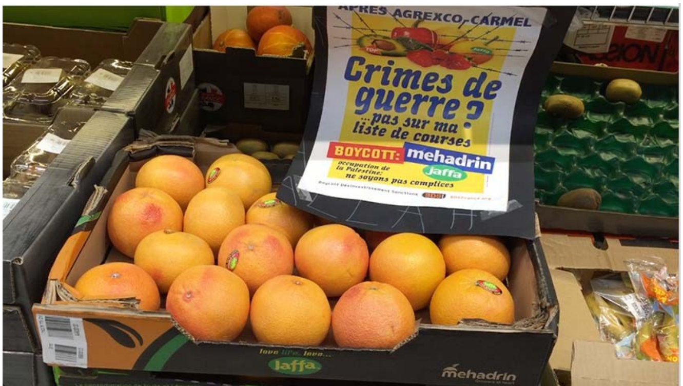
Signature devant l'entrée du magasin de la pétition contre Mehadrin et du bulletin de solidarité avec BDS...