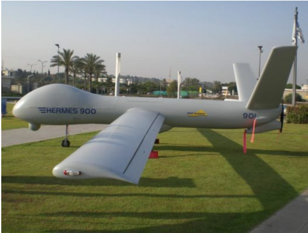
Drone Hermes d'Elbit.

L'assassinat du commandant du Hamas Ahmed Jabari – qui a marqué le début de l'assaut israélien de 2012 sur Gaza, l'opération Colonne de nuée – a été perpétré par un drone Hermes 450 d'Elbit selon Defence Today xxvi .