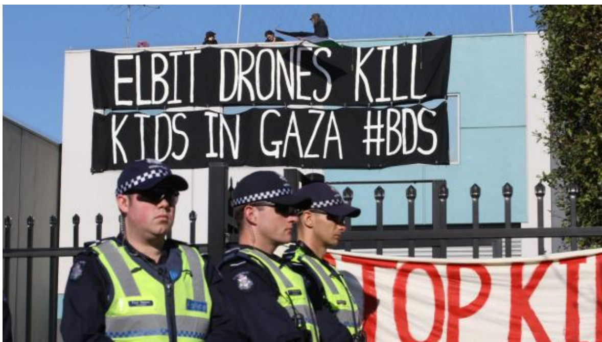
Manifestation contre Elbit

durant l'hiver 2015, le ministère de la Défense a déplacé le programme Watchkeeper à la colonie britannique d'Ascension, au milieu de l'Atlantique, invoquant un meilleur climat lxiii . Éviter l'attention publique pourrait également avoir joué un rôle dans cette décision.